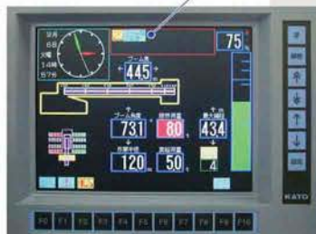
ACS表示部 「ブーム起伏低速」