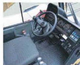
液体封入式サスペンション付キャブ