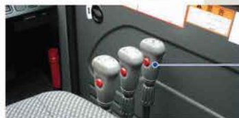
グリップ スイッチ